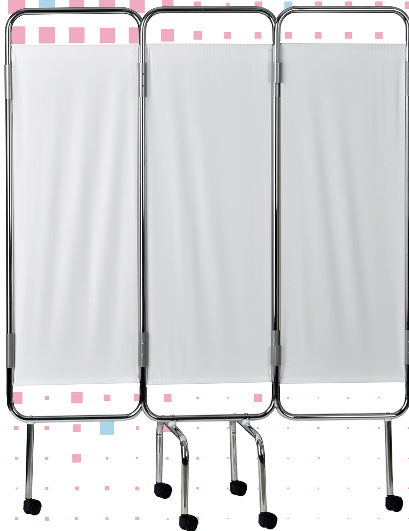
Photo du modèle avec 3 panneaux au lieu de 4 panneaux