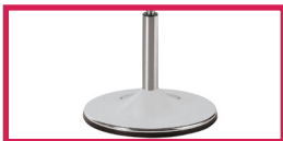
ACC 16 Pied sur socle chromé diam. 38cm (Enlève 1cm à la hauteur)