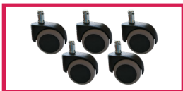
ACCROULETTE-05 5 roulettes auto-freinées en charge ou hors-charge