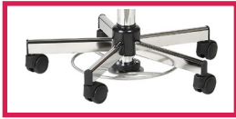
ACC 14 Commande au pied