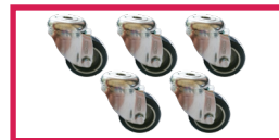
ACCROULETTE-02 5 roulettes simple galet diam. 50mm