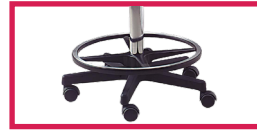
ACC 15 Repose pieds