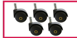
ACCROULETTE-04 5 roulettes antistatiques diam. 50mm