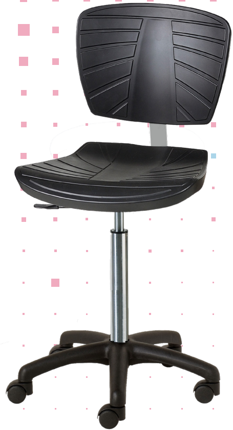
Photo du modèle avec pied ABS noir au lieu de pied aluminium poli