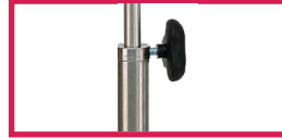
ACC 320BGS Bague de serrage inox