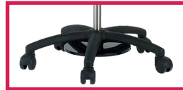
ACC 320AL Alourdisseur 3,2kg