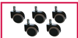
ACCROULETTE-03 5 roulettes double galet sol dur diam. 50mm