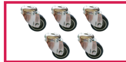
ACCROULETTE-02 5 roulettes simple galet diam. 50mm