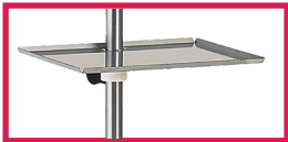
ACC 32021INO Plateau inox réglable 34x34cm