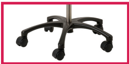
NEW Nouvelle base ABS design