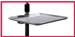
ACC 320-PLATO-PC Plateau plastique réglable 35x27cm