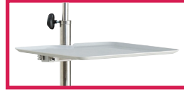
ACC 320-PLATO-PP Plateau plastique réglable 35x27cm