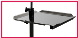
ACC 32027INO Plateau inox 31,5x27,5cm pousse seringue